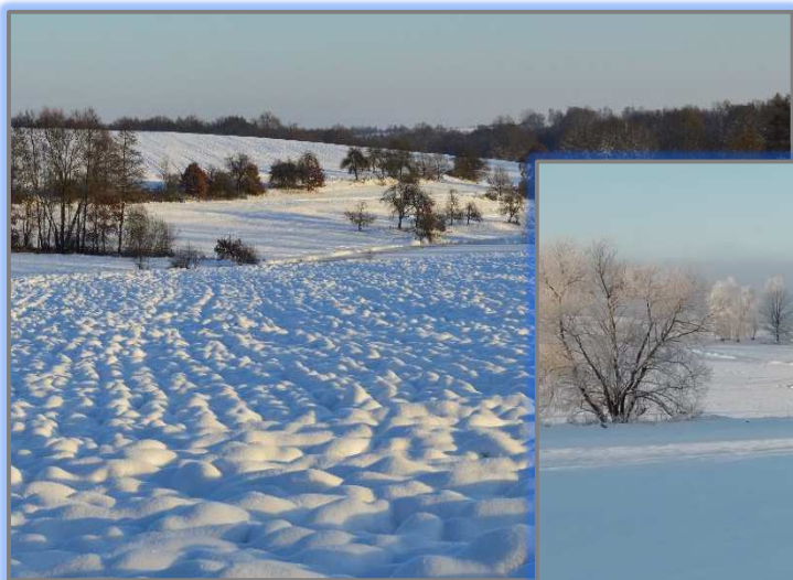
Údolí u Drsovice (Mgr. Jana Drsová)