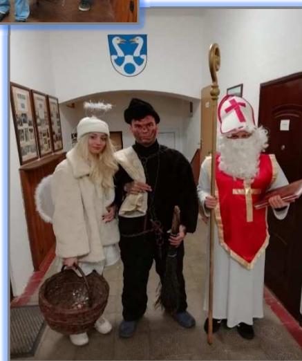
Mikuláš, anděl a čert v prosinci 2022