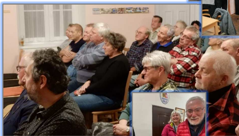
Oslava 660. výročí první zmínky o obci v listopadu 2022