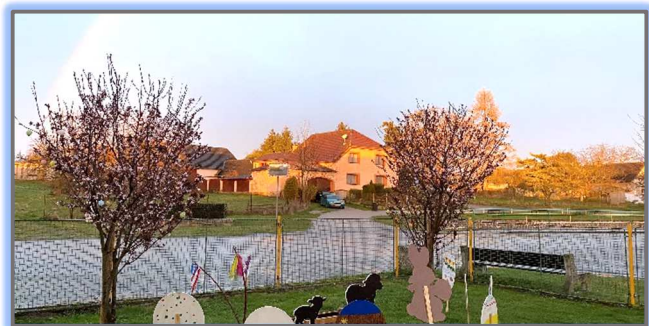
Duha nad Meznou