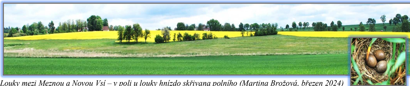
Louky mezi Meznou a Novou Vsí – v poli u louky hnízdo skřivana polního (Martina Brožová, březen 2024)